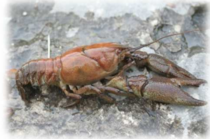
Ecrevisse à pattes blanches