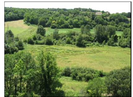
Les fonds de vallées, une mosaïque de milieux humides et aquatiques