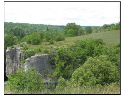
Les coteaux, une mosaïque de milieux secs : pelouses calcicoles, chênaie verte, falaises, cavités, etc.

La proximité de cavités en pied de falaises et de pelouses calcicoles (milieux secs) avec les fonds de vallées humides confère à ces habitats une importante complémentarité écologique (zones de prédation, de reproduction, de quiétude, d'hivernage...).