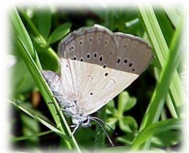
Azuré de la sanguisorbe

Guillaume PLANCHE LPO France – Les Fonderies Royales 8-10 rue du Docteur Pujos BP 90263 17 395 Rochefort 06 71 13 48 71 guillaume.planche@lpo.fr